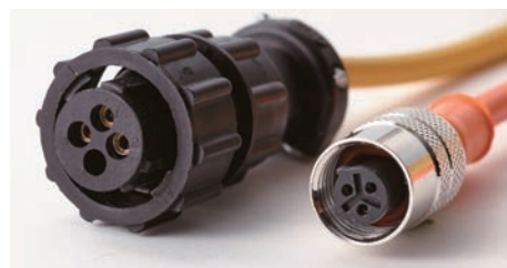
フロートセーフティコードは3P、4P両方対応

フロン回収機は運転操作が必要な機械です スムーズな作業の為に次のことを守ってください