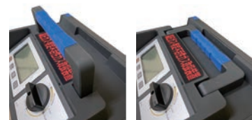
可動式のハンドル